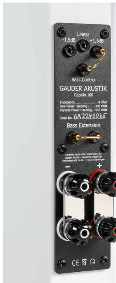
Hochwertiges Bi-Wiring-Terminal von WBT und die Möglichkeiten der Bassanpassung sind feine Extras, die die Capello bietet.

Argerich voller Leidenschaft und Akkuratess, begleitet von einem kunstvoll geführten Orchester vorwiegend junger Künstler.