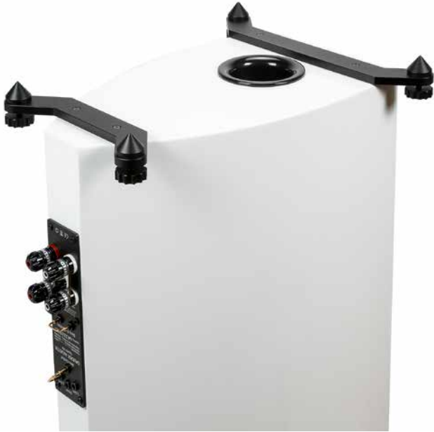
Die Traversen mit den von oben höhenverstellbaren Spikes sind an der Unterseite verschraubt, wo sich auch die Reflexöffnung befindet.